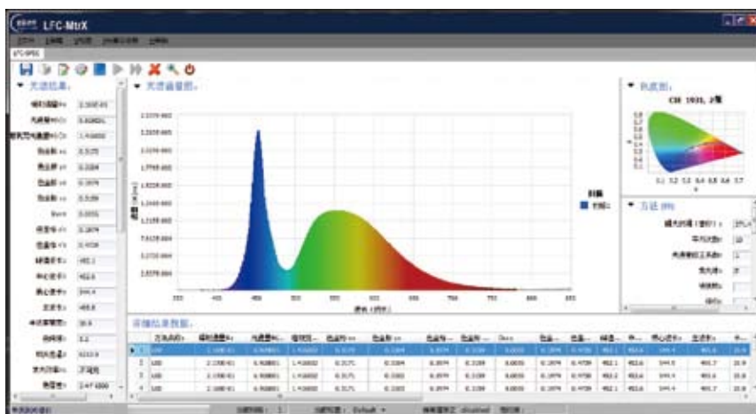
光测量软件 LFC-SPEC (中/英文)